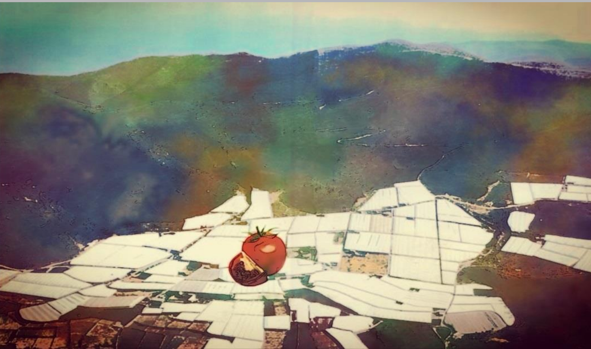
PAISAJE DE DALIAS 3