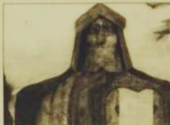
Imagen de una obra de Helio Clemente

No hay nada parecido a esta idea, asegura Helio Clemente. Quizá las cubiertas artísticas sobre zonas que durante las obras de restauración de edificios monumentales en Madrid ocultaban los andamios. Ni los intentos de Cristo de situar una muestra en Tenerife ni la decoración de árboles en los bosques vascos a cargo de Agustín Ibarola. Es más, esto lo considera una agresión a la naturaleza.