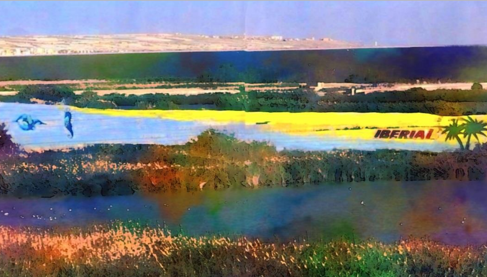
PAISAJE DE LAS MARISMAS 2