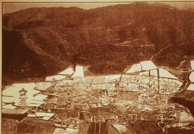
Vista de invernaderos en Almería.

Sevilla: Avda. Cardenal Bueno Monreal, s/n, C.P.: 41013. Tel.: 95 424 61 00. Fax 95 424 61 24. Publicidad Tel.: 95 424 61 10. Fax 95 424 61 16. Málaga: Salitra, 1,5ª. Granada: Aberhamar, 4 3ºb. C.P.: 18010. Tel.: 958 21 05 68. Fax: 958 22 32 43. Email andalucia@elpais.es