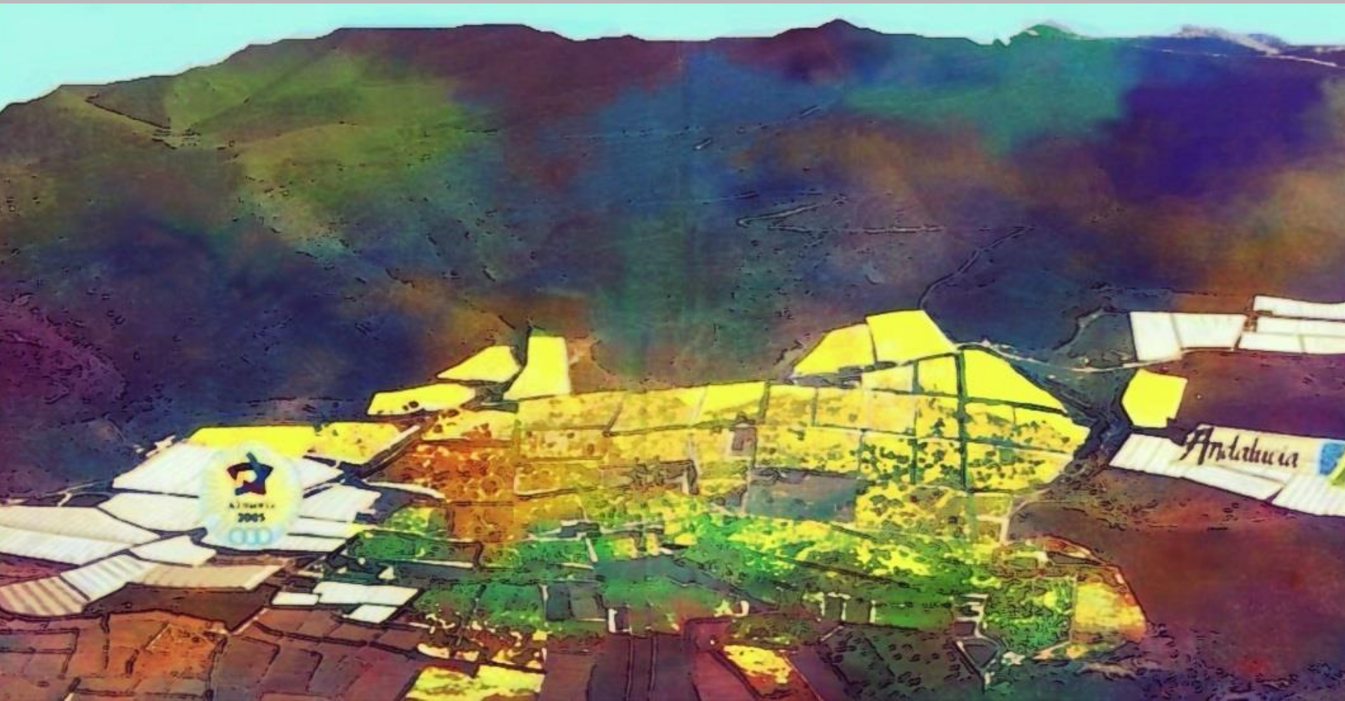
PAISAJE DE DALÍAS 1