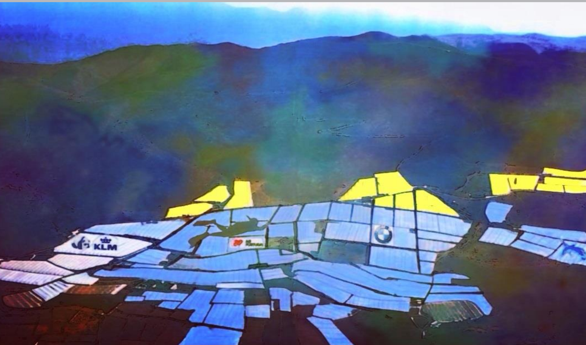
PAISAJE DE DALIAS 2