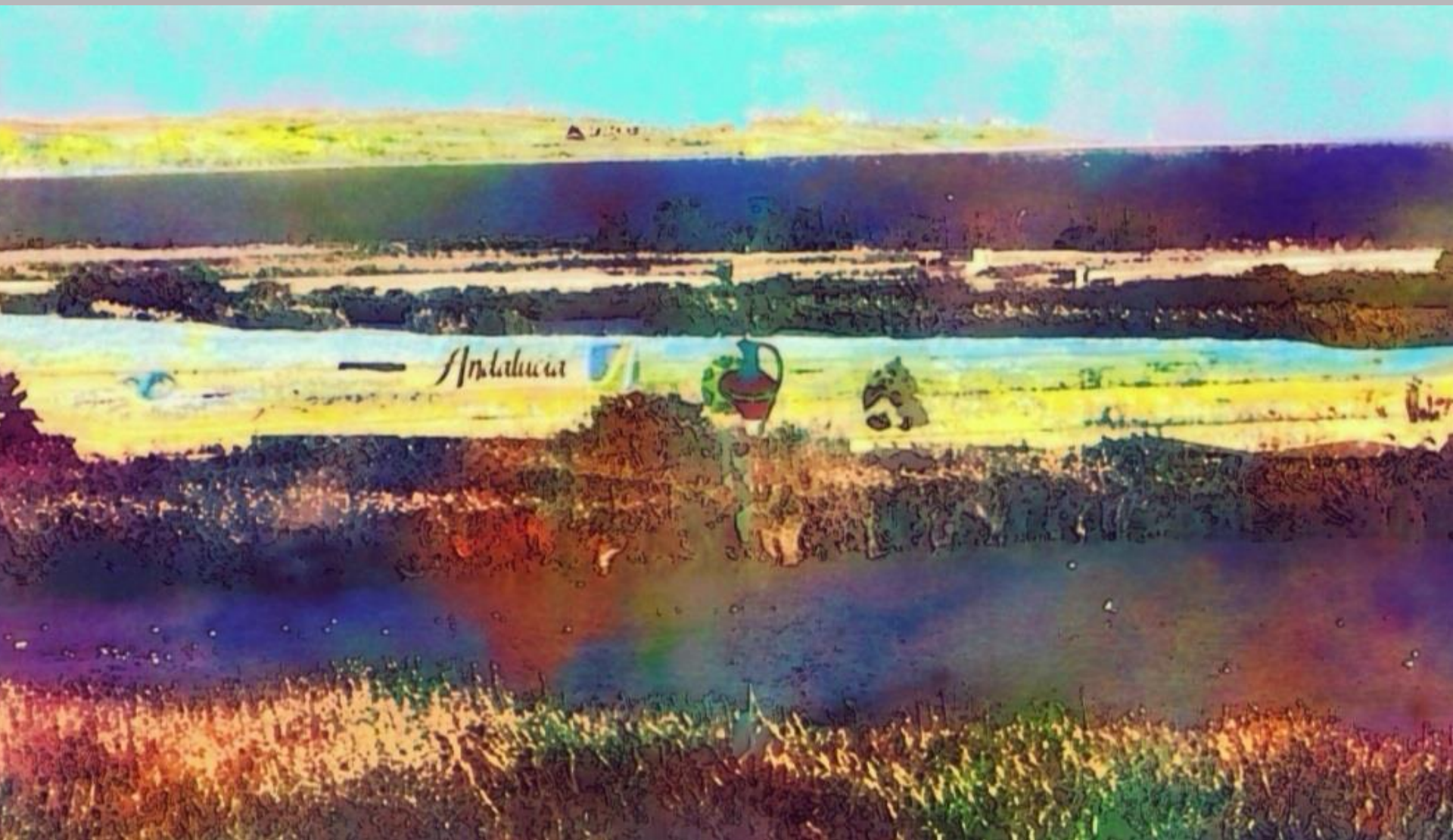
PAISAJE DE LAS MARISMAS 1