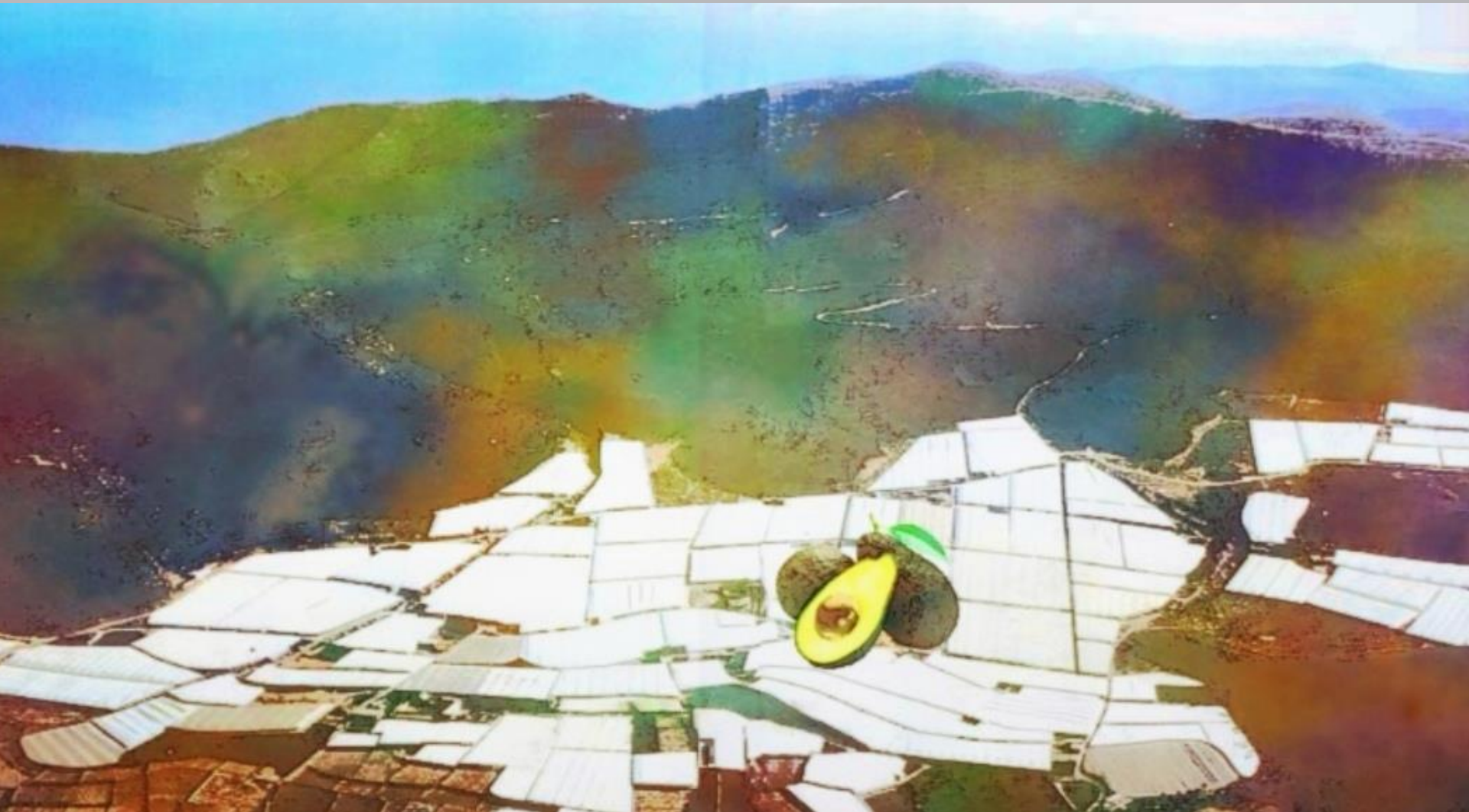
PAISAJE DE DALIAS 4